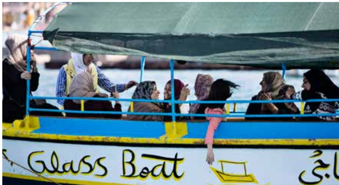
Færre turister: Jordans eneste kystby, Aqaba, er stadig et populært mål for både jordanere og vestlige turister. Men efter borgerkrigens udbrud i Syrien er antallet af turist-overnatninger i Jordan faldet markant. Det er hårdt for den jordanske økonomi.

I sammenligning med demonstrationerne i andre lande forløb Det Arabiske Forår fredeligt i Jordan. Kong Abdullah reagerede på protesterne ved at afsætte tre statsministre på 18 måneder, love reformer og etablere en uafhængig valgkommission. I juni 2018 var der igen demonstrationer i Jordan, som også forløb fredeligt.