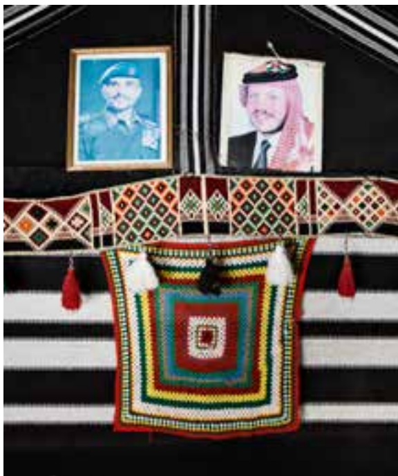
Et beduintelt i ørkenen: Den nuværende kong Abdullah den 2. (th) og hans far Kong Hussein, der regerede Jordan i 47 år.

Oktoberkrigen, der også kaldes Yom Kippur-krigen, fordi angrebet blev sat ind på dagen for den største højtid i jødedommen. Jordan og Israel indgik officiel fredsaftale i 1994.