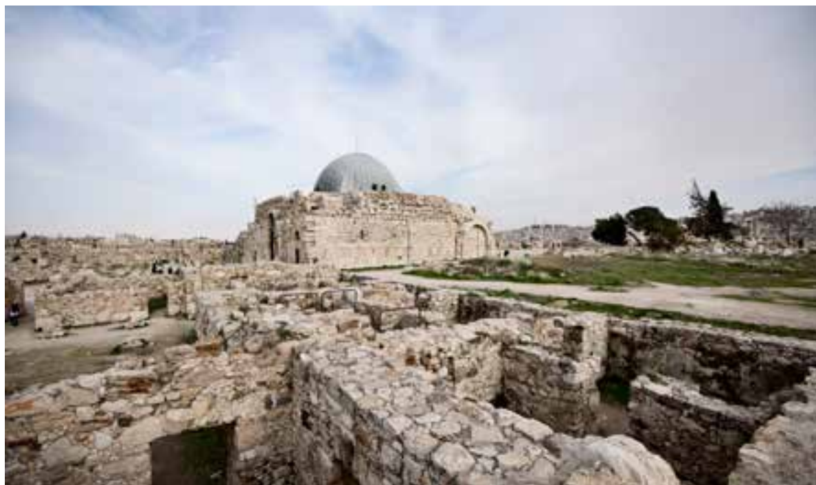
Citadellet i Amman: Fra Citadellet og den mægtige ruin af Umayyad-paladset har man en god udsigt ud over den bakkede og labyrintiske hovedstad.

Byen har flere souk'er (markeder). Det største af dem ligger ved Al-Husseini-moskeen i den østlige del af Amman. Området er en blanding af et presenning-overdækket madmarked, et hovedstrøg med små restauranter og tøjbutikker,