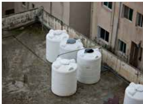
Vandtanke på taget: Vand er en knap ressource i Jordan. I større byer får man vand fra tanke, der står på de flade tage.