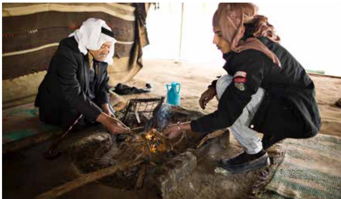
Gæster får te: Som gæst i et jordansk hjem bliver du gerne tilbudt en kop hed og sød te. Den tradition holder beduinerne også i hævd. De brygger den gerne med mynte. Teen går også under kælenavnet 'beduin-whisky'.

Jo længere sydpå i landet man kommer, des flere af de karakteristiske gedehårstelte dukker op i det sandede ørkenlandskab. Teltene er kendt som 'beit al-sha'ar', der slet og ret betyder 'et hus af hår.'