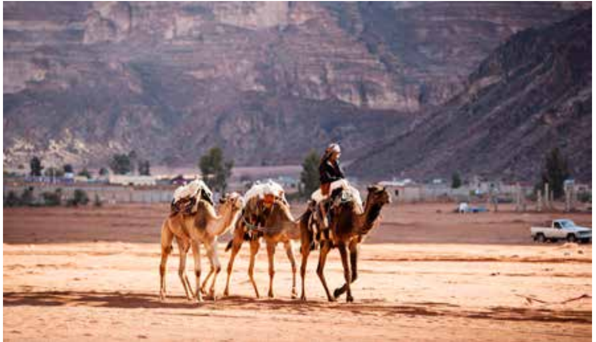
Beduinliv: Mange af beduinerne i Wadi Rum lever i dag af at tage turisterne med ud at overnatte i komfortable lejre i den røde ørken. På kamel eller i firehjulstrækker.