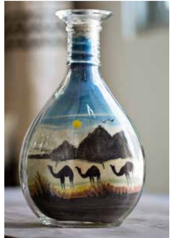
Sand-souvenir: Flasker med motiver lavet af sand i flere farver er en populær souvenir ved Jordans turistattraktioner.

Her drikkes der kaffe og te, her spilles der backgammon og her ryges der cigaretter og den