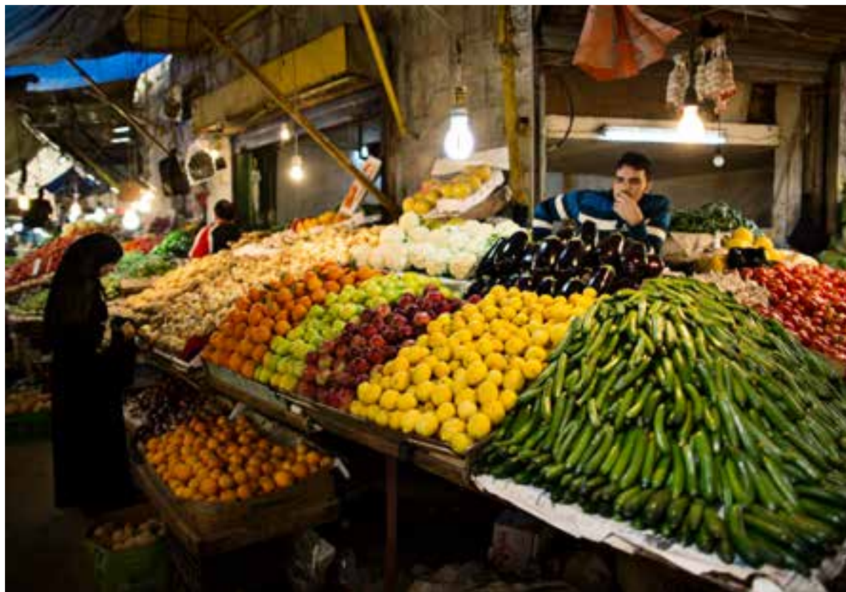
På indkøb i souk'en: Det overdækkede marked ved den store Al-Husseini moské i Amman bugner af friske varer.

Knafeh: Desertkage med en lokal type friskost, sirup og nødder.