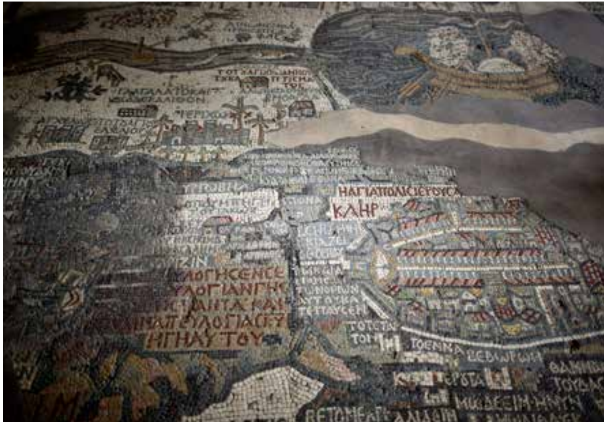
Gammel mosaik: Den berømte Madaba-mosaik viser Det Hellige Land med Jerusalem i centrum og med Det Døde Hav og Jordanfloden oven over. Nu laves der igen mosaikker i Madaba.