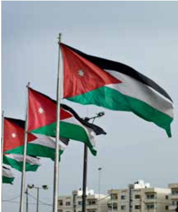
Jordans flag stammer fra det revolutionsflag, som blev brugt under Den Arabiske Revolte mod osmannerne.