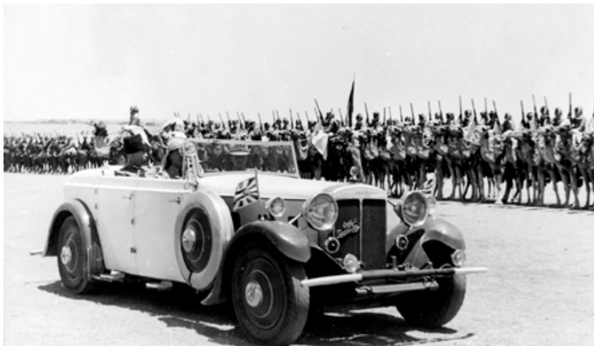
Soldater på kamelryg: Kong Abdullah den 1. inspicerer kamelkorpset, da han blev indsat som konge af Jordan den 25. maj 1946.

Abdullah den 1. blev dræbt ved et attentat i