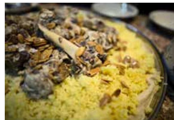
Jordans nationalret: Mansaf serveres i rigelige mængder ved særlige lejligheder.

Desserter og kager er et kapitel helt for sig, og især syrerne er kendt i regionen for at være mestre i at kombinere mandler, valnødder, pistacienødder og tyk sirup i et utal af fristende kombinationer. En særlig lækkerbid er knafeh; en let flydende ostekage med sirup og hakkede pistacienødder.