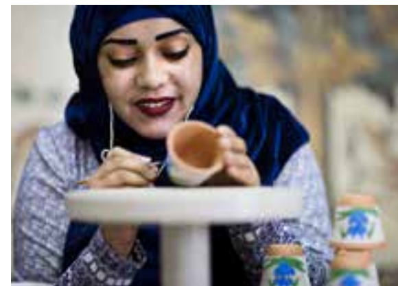
Håndværk: Dekorering af keramikopper på et håndværkscenter i byen Madaba.