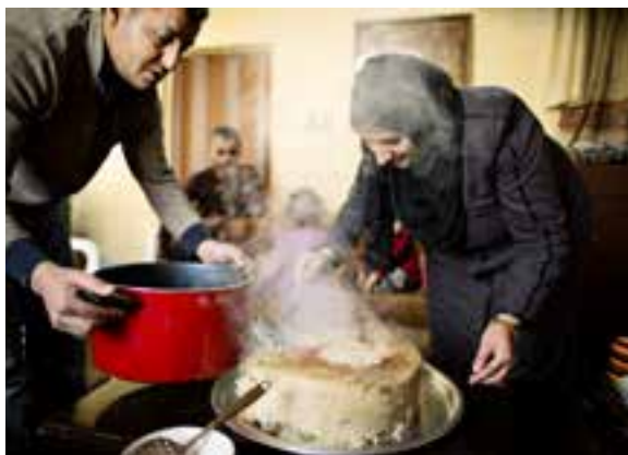
Traditionel gæste-ret: Maqloubeh er en ret af ris, grøntsager og kylling tilberedt i en stor gryde. Navnet betyder 'bunden i vejret'.